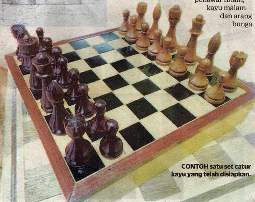
CONTOH satu set catur kayu yang telah disiapkan.

Kraf catur kayu melibatkan penggunaan beberapa jenis kayu antaranya kayu cengal, merbau, nangka, penawar hitam, kayu malam dan arang bunga.